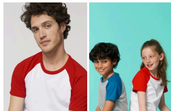
Catcher Short Sleeve Mini Catcher Short Sleeve